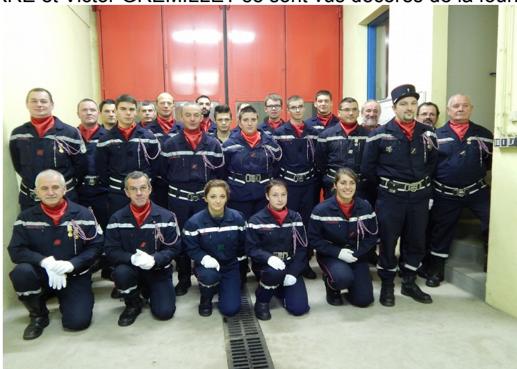
SAINTE BARBE 2015