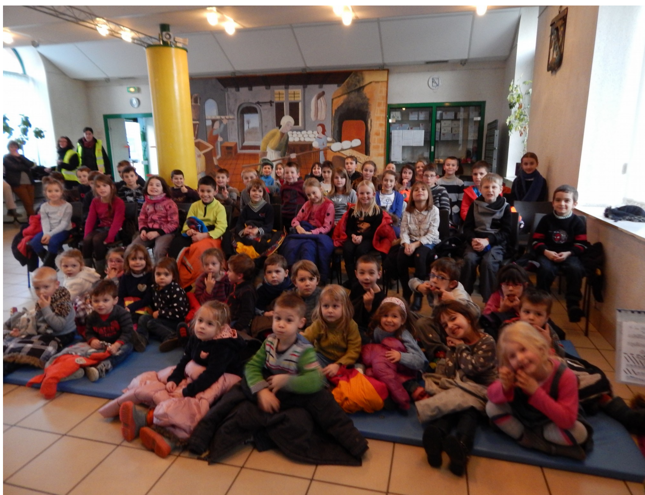
AU SPECTACLE DES NAP

Merci à l'équipe d'animation, les associations, et les bénévoles pour la qualité de l'encadrement apportée à nos enfants, futurs citoyens.