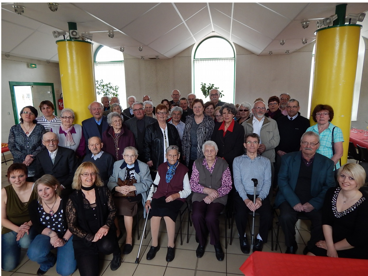
REPAS DES AINES TENDON-FAUCOMPIERRE AVEC L'ASSOCIATION FAMILIALE