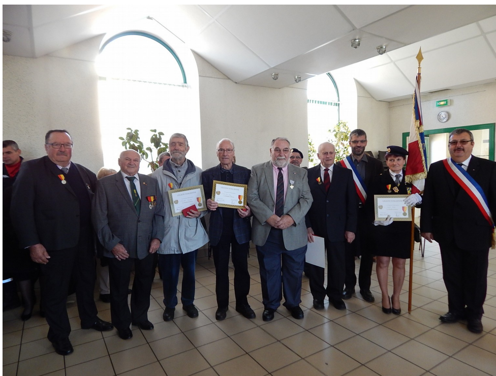
Cérémonie du 11 Novembre à Tendon