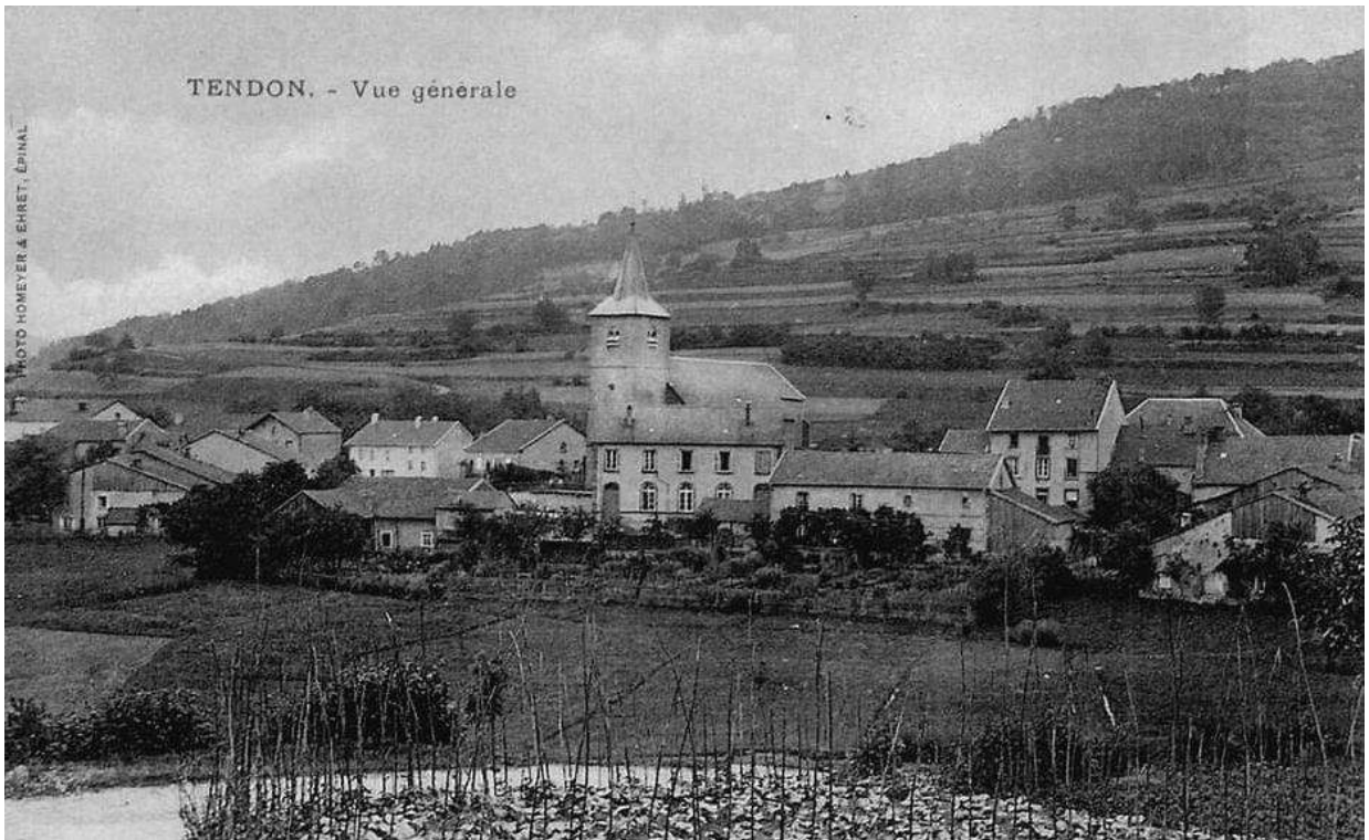
TENDON, - Vue générale

Vue générale - En venant de la Cascade - Vue vers Fauconpierrre et le Château Saint-Jean