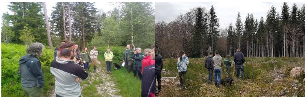
Travaux commission Forêt

Pour l'investissement 2021, un budget de 45 850 € a été établi pour des travaux sylvicoles et des achats de parcelles forestières au fil des propositions reçues.